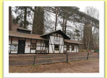
Eiswoog bei Ramsen