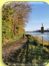
Hördt - Treidlerweg