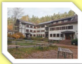
Carlsberg NFHaus Rahnenhof